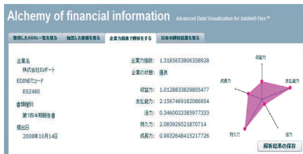
図3: 企業力指数の解析結果

企業力指数をはじめ収益力、支払能力、活力、持久力、成長力の計算ができる。それらを計算するために必要な売上高や流動資産などの値を、APIを利用することで取得している。また、それらの計算結果はレーダーチャート表示にすることもでき、図3のように視覚的に企業の状態を把握することができる。